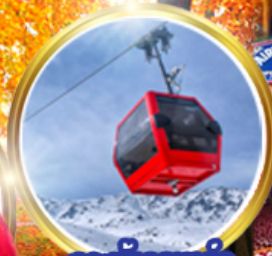
กระเช้ากุลมาร์ต ชมวิวสุดอลังการ