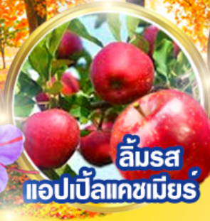
ลิ้มรส แอปเปิ้ลแคชเมียร์