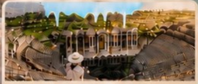
เมืองเซียราโพลิส