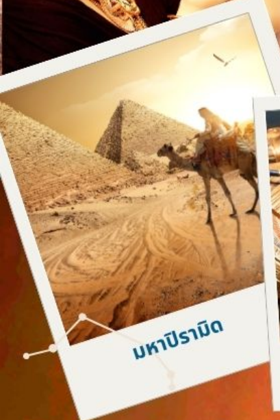
มหาปิรามิด