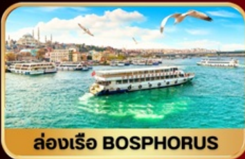
ล่องเรือ BOSPHORUS