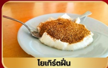
โยเกิร์ตผืน