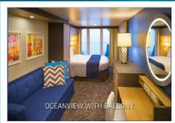
OCEANVIEW WITH BALCONY