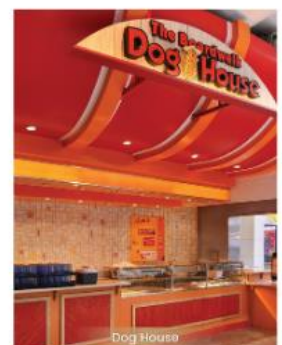
The Dog House DOG HOUSE