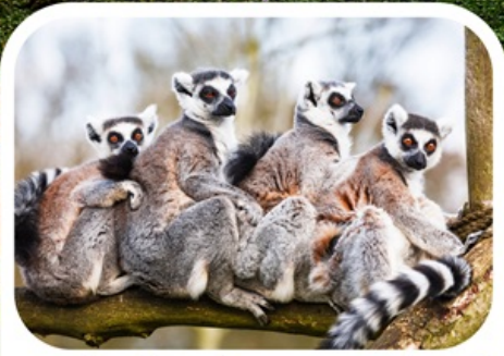
เลมูร์สัตว์ประจำเกาะมาดากัสการ์