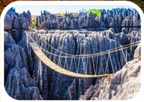
อุทยานแห่งชาติซิงกี เดอ เบอมาราฮา