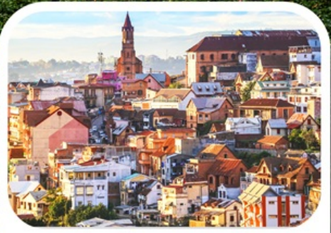
เมืองอันตานานารีโว