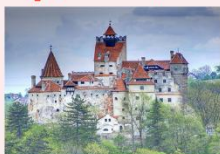
ปราสาทแดร์ริคูล่า

** พักที่ Ramada by Wyndham Sibiu Hotel 4* หรือเทียบเท่า **