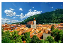
เมืองบราซอฟ