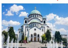
วิหารเซนต์ซาวา