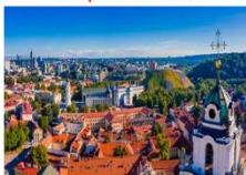
Vilnius Old Town