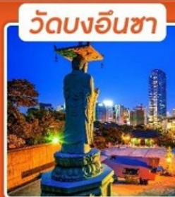
วัดบงอินซา