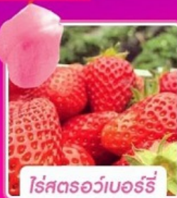
โรสตรอว์เบอร์รี่