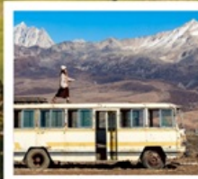
เมืองลอยฟ้าเก๋ดีลามู่

ทัวร์คุณธรรม ไม่ลงร้านช้อปปิ้ง ไม่ขายออฟชั่น