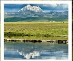
ดวงตาแห่งต่ำง

หมู่บ้านทิเบตเจียงจิว • จุดชมวิวกุหลาบหิมะหยา • ปาหลาง สวนหินปาหลาง • จุดชมวิวดวงตาแห่งต่ำง • วัดมู่หย่า หมู่บ้านเก๋อริ้อหม่าซุน • ซินตูเจียง • หมู่บ้านกุ่มงซุน หมู่บ้านปาหลางเจียงตู • เมืองลอยฟ้าเก๋ดีลามู่ • ภูเขาเจ้อตั่วซัน ถนนสายรุ้ง • ทะเลสาบแดง • ถนนคนเดินชอยกวางแคบ