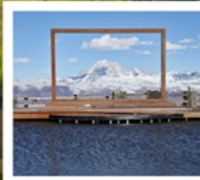
ปาหลางเจียงตู