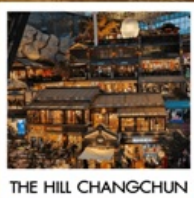
THE HILL CHANGCHUN