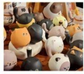
โรงงานเซรามิกเตาเอ๋อด่าง