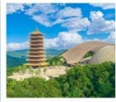
ภูเขาหนิวโถ้วซาน