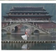
เมืองโบราณฟังหวง