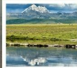
ดวงตาแห่งถ้ำกวาง