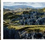
สวนหินปาเหมย์