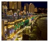
ถนนหนานปิ่น