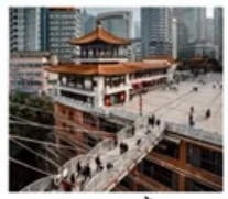
ตึก 22 ชั้น