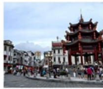
เมืองเก๋าฮ่าวเถา