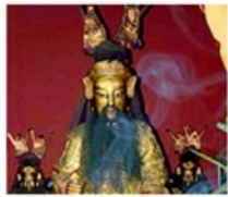
เอียงบู๊ซิว