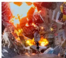
SPACE & TIME CUBE