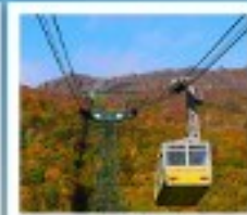
ภูเขาไฟอุสุ