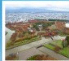
โทริยวคะกุ ทาวเวอร์

หุบเขานรกจิโระคุดาบิ / โทดองฮิจูเอ็งคานโมริ ตลาดเช้าเมืองฮาโกดาเตะ / โทริยวคะกุ ทาวเวอร์ ภูเขาไฟอุสุ / จุดชมวิวยุซึกิ / ค่องเรือชมทะเลสาบโทโย สวนอุสึกิโตะ / สวนพฤกษศาสตร์ / เก็บผลไม้ / สัมผัสน้ำพุร้อนที่ พิพิธภัณฑ์คองดงดริ / ภาวนิภาอินน้ำโบราณ / โรงปั้นแก้วคิตาฮิชิ เนินพระพุทธรเจ้า / ถนนฮิโอบิซึงทากุทากิ / ย่านซูซุกิโนะ