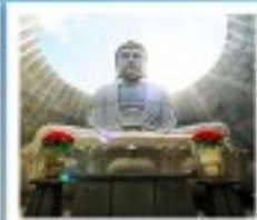
เนินพระพุทธรเจ้า