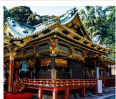
ศาลเจ้าคุโนซังโทโกซุ