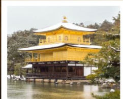
ปราสาททองคิงคะคุจิ

ปราสาททองคิงคะคุจิ / ศาลเจ้าฟูชิมิ อิโนะริ / จุดชมวิวนิฮอนงาโอะ / ศาลเจ้าคุโนซังโทโกซุ / โทเกมบะ ปริเมียม เอ้าท์เล็ต โอซึโนะ ฮักโกะ / เมืองควาโทเกะ / ตรอกคาซึยะโยโคโจ / ย่านคุระซึคุริ / ตลาดคริสต์มาสโตเกียว / ตลาดปลาซึกิจิ / วัดอาซากุสะ