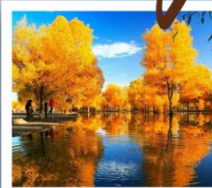
สวนต้นหูหยาง

พิธีเปิดเมืองเก่า / เมืองโบราณคัชการ์ / มัสยิดอิดคาห์ / ถนนคนเดินHandmade / โรงน้ำชาอียิป / ทะเลสาบไ้ซาหุ / ทะเลสาบกาลาคู่ค้อ ภูเขาหิมะ: Muztagh Peak / ทะเลทรายทากาลามากัน / จุดชมวิวทะเลแดง / แกรนด์แคนยอนเทียนชาน / สวนต้นหูหยาง / สวนหลงชาน / ตลาดต้าปาจา