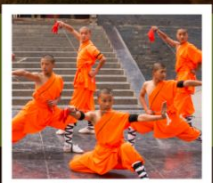
โชว์เล่าหลิน

PERIOD 1 : 9 - 14 สิงหาคม | PERIOD 2 : 18 - 23 ตุลาคม 2567