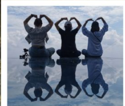
เขาหลิงซาน