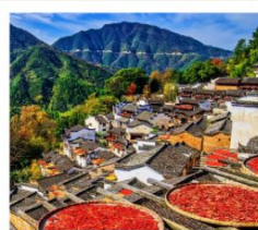
หมู่บ้านหวงหลิ่ง