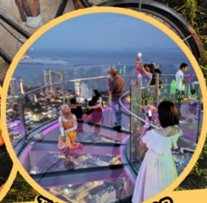
THE TOP KOMTAR