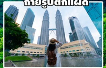
ถ่ายรูปตึกแฝด