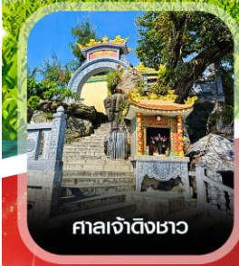
ศาลเจ้าดิงเซา