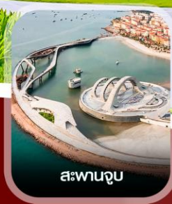
สะพานจูบ

✈️ คอนเฟิร์ม ออกเดินทาง ทุกพีเรียด 2 ท่านขึ้นไป