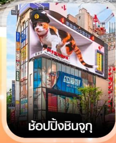
ซ้อปปิ้งชินจูกุ