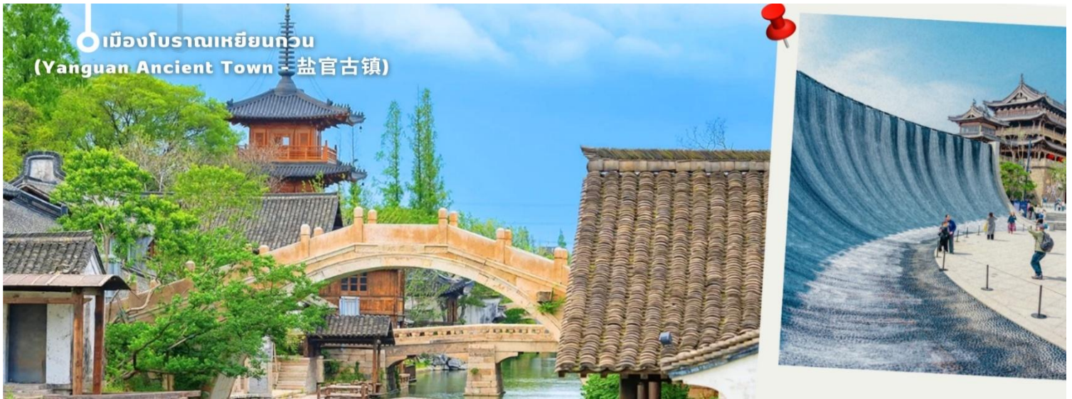
เมืองโบราณเหยียนกวน (Yanguan Ancient Town - 盐官古镇)

แวะชมผลิตภัณฑ์จากหยก งานฝีมืออันสวยงาม ขึ้นชื่อของจีนถือว่าถ้าใครมาจีนต้องแวะชมผลงานที่ผลิตจากหยก น่าเก็บสะสมเป็นอย่างมาก จากนั้นนำท่านเดินทางกลับเมือง เซี่ยงไฮ้ (ใช้เวลาเดินทางประมาณ 2 ชั่วโมง) นำท่านช้อปปิ้งย่าน ถนนนานจิง Nanjinglu Street ศูนย์กลางสำหรับการช้อปปิ้งที่คึกคักมากที่สุดของนครเซี่ยงไฮ้ รวมทั้งห้างสรรพสินค้าใหญ่ชื่อดังกว่า 10 แห่ง และช้อปปิ้ง ร้าน POP MART สุดฮิตในขณะนี้เพื่อเป็นของฝากที่ระลึก นำท่านสู่บริเวณ หาดว้ายทาน ตั้งอยู่บนฝั่งตะวันตกของแม่น้ำหวงผู้มีความยาวจากเหนือจรดใต้ถึง 4 กิโลเมตร เป็นเขตสถาปัตยกรรมที่ได้ชื่อว่า “พิพิธภัณฑ์สิ่งก่อสร้างหมื่นปีแห่งชาติจีน” ถือเป็นสัญลักษณ์ที่โดดเด่นของมหานครเซี่ยงไฮ้