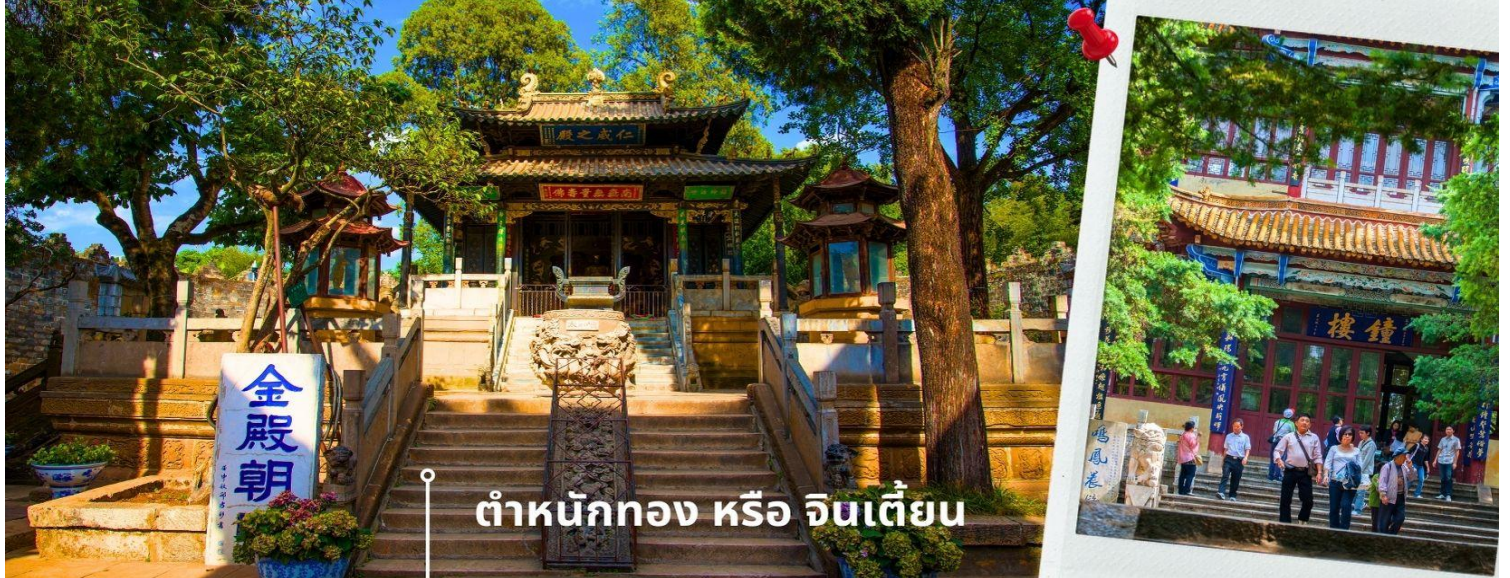
ตำหนักทอง หรือ จินเตี้ยน

นำท่านเยี่ยมชม ตำหนักทอง หรือ จินเตี้ยน (The Golden Temple Park | Jindian park) (ไม่รวมค่ารถแบดเตอร์ 15 หยวน/ท่าน) โบราณสถานสำคัญของมณฑลยูนนาน ที่ได้รับการปกป้องดูแลโดยรัฐบาลจีน ตั้งอยู่บริเวณเชิงเขาหมิงเฟิง ล้อมรอบด้วยแนวกำแพงและหอคอยเหมือนเป็นป้อมปราการ ตำหนักทองถูกเรียกตามลักษณะอาคารที่มีสีทองอร่าม จากทองเหลืองในส่วนของผนังและหลังคา รวมกว่า 200 ตัน โดยถือเป็นสิ่งปลูกสร้างด้วยสัมฤทธิ์ที่ใหญ่ที่สุดของจีน ภายในมีรูปปั้นทองโดยมีเงินอยู่ (เสวียนอู่) เทพเจ้าลัทธิเต๋าเป็นองค์ประธาน