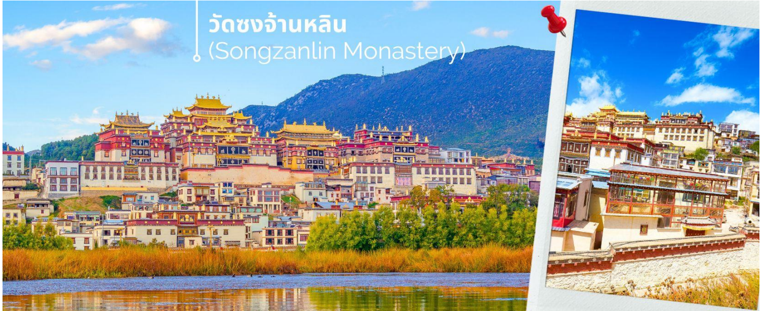
วัดซงจ้านหลิน (Songzanlin Monastery)

นำท่านชม วัดซงจ้านหลิน เป็นวัดลามะที่ใหญ่ที่สุดของมณฑล ยูนนานทางภาคตะวันตกเฉียงใต้ของจีน ถูกสร้างขึ้นในปี ค.ศ.1679 อยู่ห่างจากตัวเมืองแชงกรีล่า 5 กิโลเมตร วัดนี้เป็นอีกหนึ่งสถานที่ท่องเที่ยวสำคัญของเมืองแชงกรีล่า ประเทศจีน ถ้ามาเที่ยวแชงกรีล่าแล้วไม่ได้แวะมาวัดซงจ้านหลินก็ถือว่ายังไม่ถึงแชงกรีล่า ด้านนอกวัดสามารถถ่ายรูปได้ แต่ภายในอาคารวัดห้ามถ่ายรูป จากนั้นเดินทางสู่ เมืองลี่เจียง