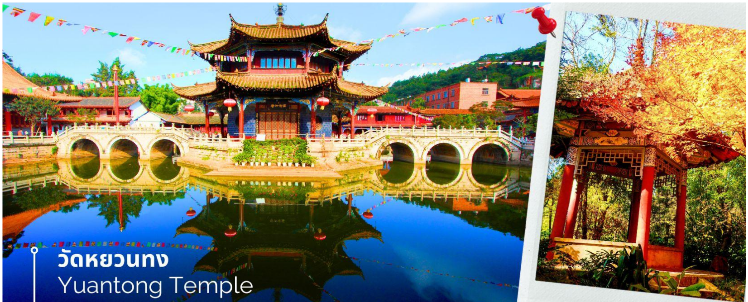
วัดหยวนทอง Yuantong Temple

นำท่านชม วัดหยวนทอง (Yuantong Temple) วัดแห่งนี้เป็นวัดที่ใหญ่และเก่าแก่ที่สุดในเมืองคุนหมิง สร้างมาตั้งแต่สมัยราชวงศ์ถัง มีอายุยาวนานประมาณ 1,200 กว่าปี การสร้างวัดแห่งนี้จะแปลกตากว่าวัดอื่นในจีน เพราะปกติแล้วการสร้างวัดของจีนส่วนมากจะต้องสร้างอยู่บนภูเขา แต่วัดหยวนทองสร้างวัดต่ำกว่าภูเขา โดยวิหารจะอยู่ต่ำที่สุดเนื่องจากวัดแห่งนี้ไม่ได้สร้างขึ้นเพื่อเป็นวัดโดยตรง แต่เคยเป็นศาลเจ้าแม่กวนอิมมาก่อน