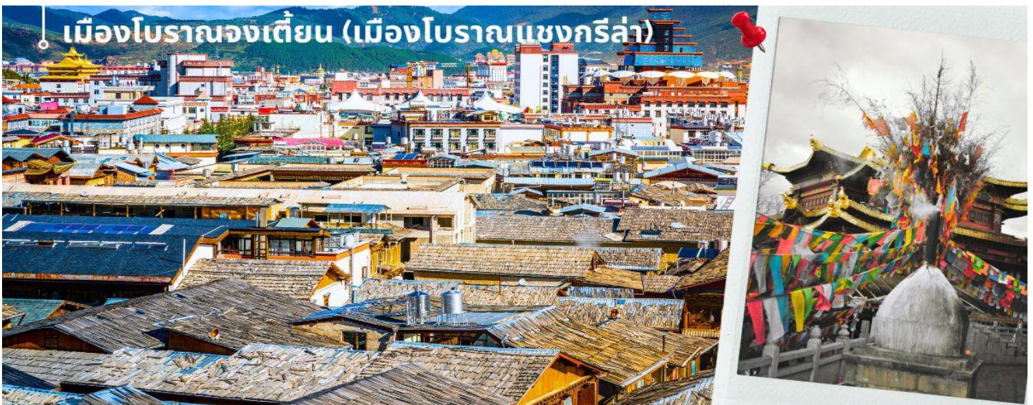
เมืองโบราณจงเตี้ยน (เมืองโบราณแซงกรีล่า)

นำท่านชม เมืองโบราณจงเตี้ยน (เมืองโบราณแซงกรีล่า) ตั้งอยู่ในเขตปกครองตนเองชนชาติทิเบต ตีซิง ทางตะวันตกเฉียงเหนือของมณฑลยูนนาน ที่ราบสูงทางภาคตะวันตกเฉียงใต้ของประเทศจีน มีชนชาติส่วนน้อย 25 ชนชาติอาศัยกันอยู่ อาทิ ชนชาติทิเบต ลีซอ น่าซี ไป และอี เป็นต้น ศูนย์รวมของวัฒนธรรมชาวทิเบต ลักษณะคล้ายชุมชนเมืองโบราณทิเบต ซึ่งเต็มไปด้วยร้านค้าของคนพื้นเมือง ร้านขายสินค้าที่ระลึกมากมาย