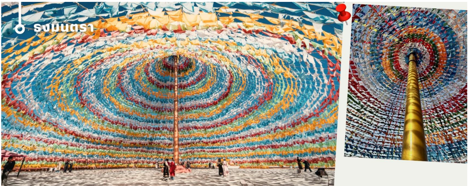
ร่งมนตรา

จากนั้นนำท่านเดินทางสู่ ร่งมนตรา (Prayer Flags) สัญลักษณ์อันโดดเด่นแห่งวัฒนธรรมทิเบต ซึ่งพบเห็นได้ทั่วไปตามพื้นที่ภูเขาสูงของเมืองแชงกรีล่า ชาวทิเบตเชื่อว่าธงเหล่านี้จะพัดพาคำอธิษฐานและพลังแห่งความปรารถนาดีไปกับสายลม เพื่อนำพาความสุข ความสงบ และความเจริญรุ่งเรืองมาสู่ผู้คน สี่ทั้งห้า ได้แก่ น้ำเงิน ขาว แดง เขียว และเหลือง เป็นตัวแทนของธาตุทั้งห้า คือ ท้องฟ้า ลม ไฟ น้ำ และดิน สื่อถึงความสมดุลและความกลมกลืนของธรรมชาติ