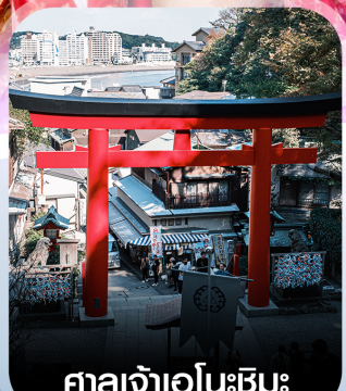
ศาลเจ้าอินะชิมะ