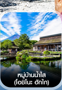
หมู่บ้านน้ำใส (โอชิโนะ อักไก)