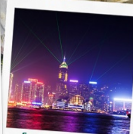
โชว์ SYMPHONY OF LIGHT