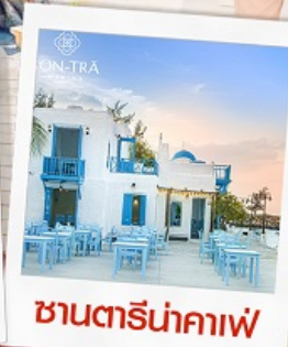
ซานตารีน่าคาเฟ่