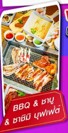
BBQ & รมุ & ซาซิมิ บุฟเฟ่ต์