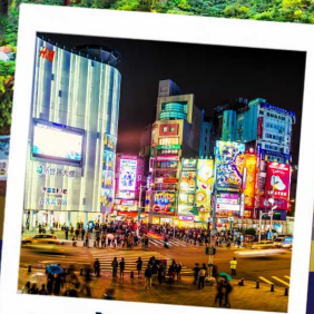
ช้อปปิ้งซีเหมินติง