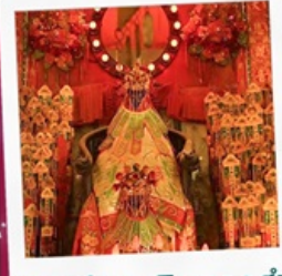
เจ้าแม่กวนอิมสองฮา