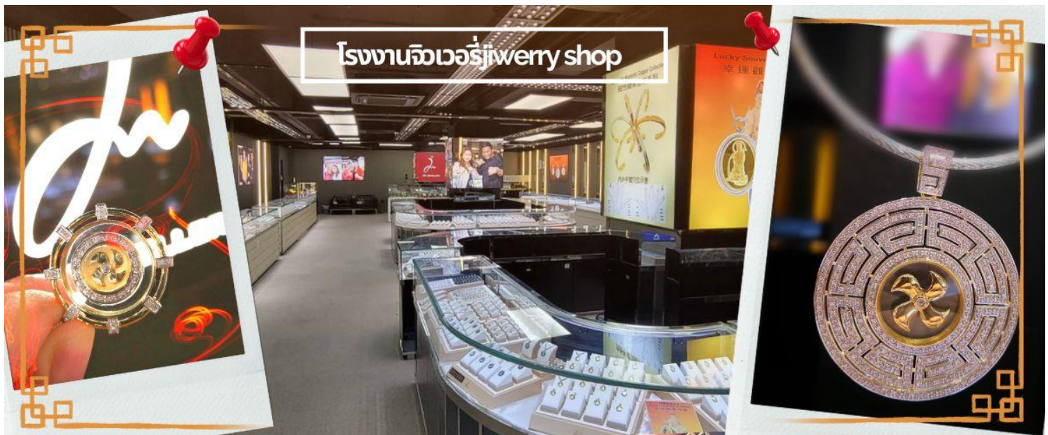
โรงงานจิวเวอรี่jewelry shop

จากนั้นนำท่านชม โรงงานจิวเวอรี่ ซึ่งเป็นโรงงานที่มีชื่อเสียงที่สุดของฮ่องกงในเรื่องการออกแบบเครื่องประดับ อาทิเช่น จี้ และแหวนกำหั้น ที่สวยงามโดดเด่นไม่เหมือนใคร ซึ่งถือกำเนิดขึ้นที่นี่และมีชื่อเสียงที่สุดใช้เป็นเครื่องประดับติดตัว และเสริมดวงชะตา สินค้าทุกชิ้นมีเอกสารรับประกันคุณภาพเปลี่ยน ซ่อม ใต้ตลอดอายุการใช้งาน หากเกิดการชำรุดจากสินค้าไม่ใช่อุบัติเหตุ และนำท่านเลือกซื้อ เครื่องประดับที่ ร้านหยก ซึ่งคนจีนนั้นถือว่าหยกเป็นหิน ที่เป็นตัวแทนของความสวยงามและความบริสุทธิ์ มีความเชื่อว่าหยกมงคล ถ้าพกติดตัวไว้จะอายุยืนและสุขภาพดี