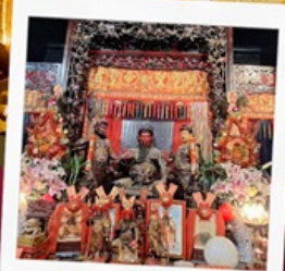
เทพเจ้ากวนอู วัดกวนไท่