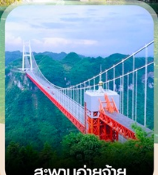
สะพานอ้ายจ้าย