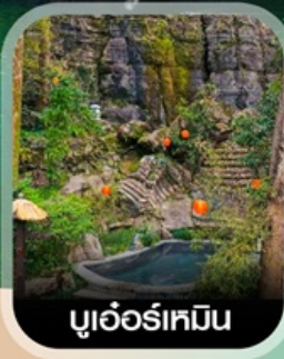
บูเออร์เหมิน