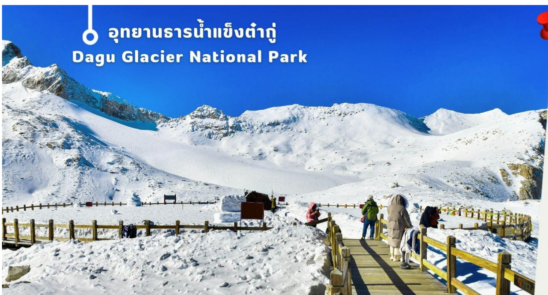
อุทยานธารน้ำแข็งต้ากู่ Dagu Glacier National Park

จากนั้นนำท่านเดินทางสู่ เมืองเฮยซู่ (ใช้เวลาเดินทางประมาณ 2 ชั่วโมง)เพื่อเดินทางไปยัง อุทยานธารน้ำแข็งต้ากู่ (รวมกระเช้าขึ้นลง) ต้ากู่ปังชว่น หรือ Dagu Glacier National Park เป็นธารน้ำแข็งกลาเซียร์ที่สวยงามที่สุดแห่ง