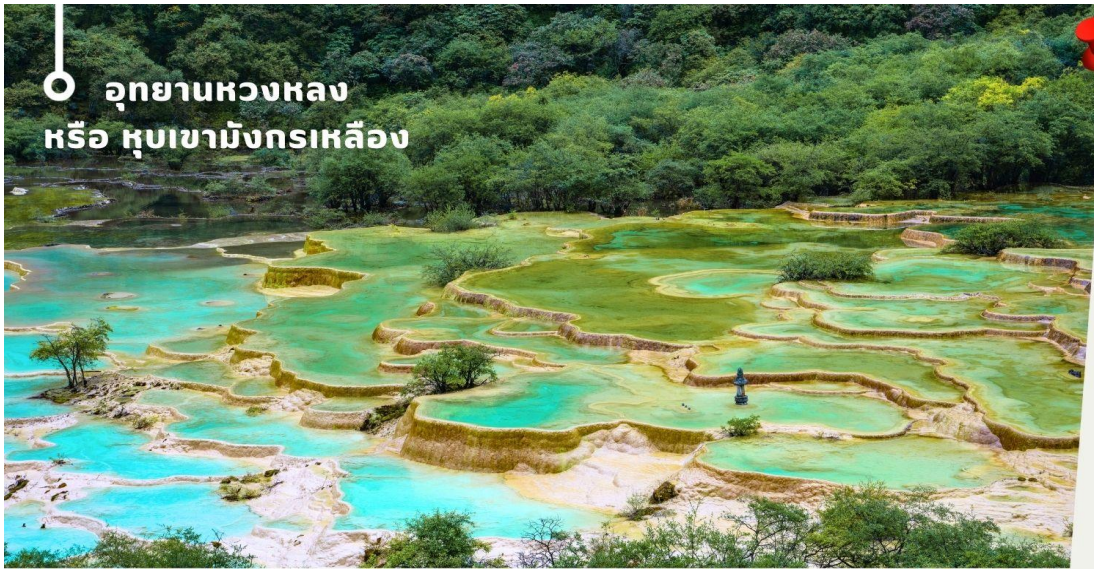
อุทยานหวงหลง หรือ หุบเขามังกรเหลือง