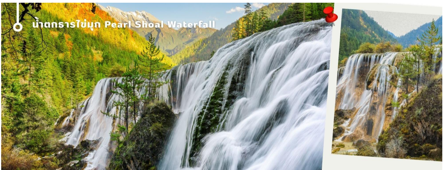
น้ำตกธารไข่มุก Pearl Shoal Waterfall