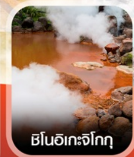
ฮีนอิเกะจิกุ

✈️ คอนเฟิร์ม ออกเดินทาง ✈️ ทุกพีเรียด 2 ท่านขึ้นไป