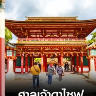
ศาลเจ้าตาไซฟุ