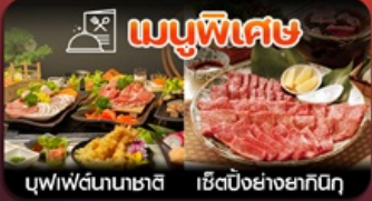
เมนูพิเศษ บุฟฟัดนาชาติ เซ็ตบั้งย่างยากิบิ

ฟุกุโอกะ-วัดนินโซอิน-หมู่บ้านยูฟูอิน-แบบบุ-บ่อนรกจิกุ-แซ่ออนเซ็น-ซ้อปบั้งเทนจิน-พักใกล้แหล่งช้อปปิ้ง2คืน