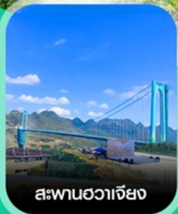
สะพานฮวาเจียง

เช็กอินก่อนใคร สะพานที่สูงที่สุดในโลก สะพานฮวาเจียง น้ำตกหวงกั๋วชู่ หมู่บ้านวู่เจียจ้าย