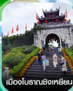
เมืองโบราณชิงเหยียน

✈️ คอนเฟิร์มออกเดินทาง ✈️ ทุกพีเรียด 2 ท่านขึ้นไป