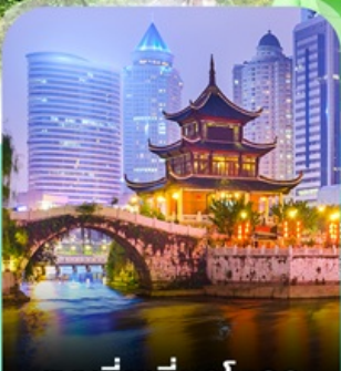
หอเจียเซียงโหลว