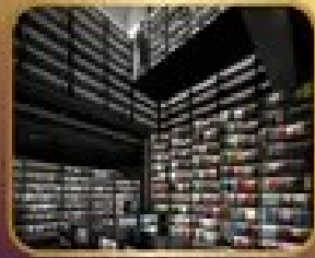
ชมร้านหนังสือ