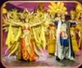
การแสดงละครเวที