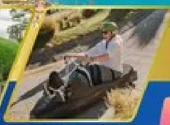
เล่นลuge ที่กรีนสทาวน์

AUCKLAND / ROTORUA / CHRISTCHURCH FOX GLACIER / FRANZ JOSEF / QUEENSTOWN พิกจ็อคแลนด์ 2 คืน / โรโตรัว 1 คืน / พิกโครสต์เชิร์ช 2 คืน พิกฟรานซ์โจเซฟ 1 คืน / คริสต์ทาวน์ 2 คืน