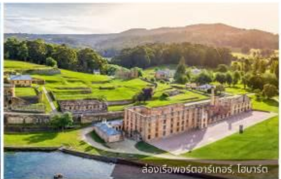
ล่องเรือพอร์ตอาร์เทอร์, โฮบาร์ต