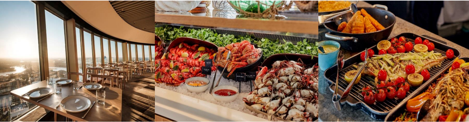
*** รูปเพื่อการโฆษณาเท่านั้น ***

ค่า นำท่านขึ้นหอคอยซิดนีย์ พร้อมรับประทานอาหาร บุฟเฟ่ต์นานาชาติ SKYFEAST AT SYDNEY TOWER RESTAURANT พร้อมชมวิวของนครซิดนีย์อันสวยงามในยามเย็น