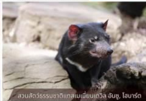
สวนสัตว์ธรรมชาติแทสเมเนีย เดวิล อินซู, โฮบาร์ต