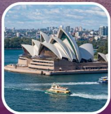
ล่องเรือชมโอเปร่า เฮ้าส์