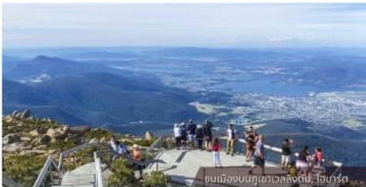
ชมเมืองบนภูเขาเวลลิงตัน, โฮบาร์ต