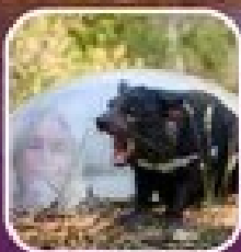
สัตว์หายากในซิดนีย์