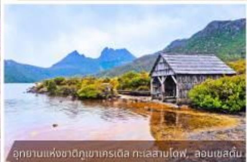
อุทยานแห่งชาติภูเขาคเรตเติล ทะเลสาบโตฟ, ลอนเซสตัน