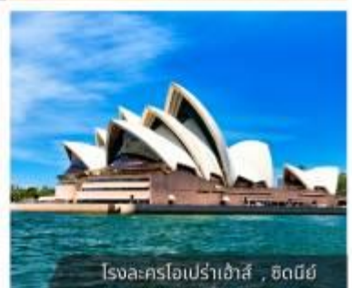
โรงละครโอเปร่าเฮ้าส์, ซิดนีย์