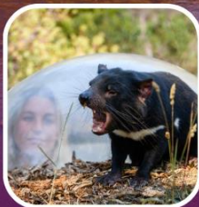
แทสเมเนียนเดวิล อันชู