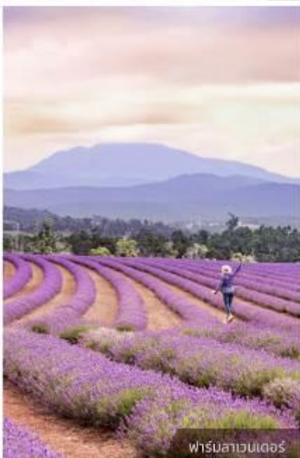
ฟาร์มลาเวนเดอร์