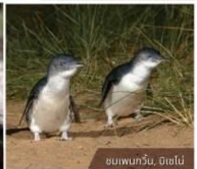
ชมเพนกวิน, ดิเซย์