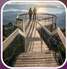
เขากีโวลดิงตัน