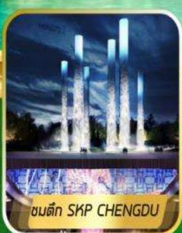
ชมตึก SKP CHENGDU