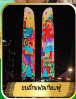
ชมตึกแพนด้าเทียนฟู่