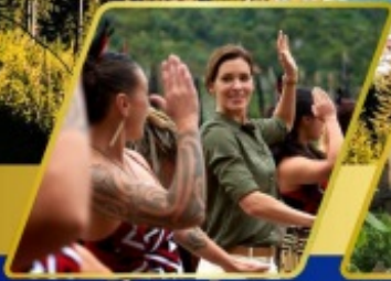
หมู่บ้านเมารี