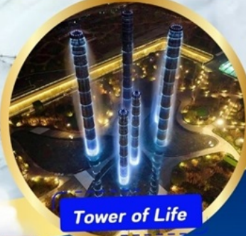
Tower of Life