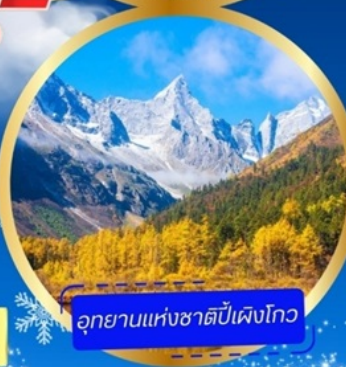
อุทยานแห่งชาติพีพีเฟิงโกว