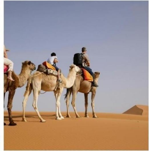
ขี่อูฐชมเนินทรายหมิงซาซาน

OPTION TOUR เลือกซื้อบริการเสริม สัมผัสบรรยากาศแบบย้อนยุคของเส้นทางสายไหมโบราณ ด้วยการขี่อูฐเดินไปตามสันทรายราวกับขบวนคาราวาน ที่ล่ำเลียงสินค้าของพ่อค้าในยุคโบราณ ให้ท่านได้ซึมซับ และถ่ายรูปภาพแห่งความประทับใจอย่างเต็มอิม : ขี่อูฐ (ค่าบริการ 180 หยวน ต่อท่าน ต่อรอบ) / ถุงเท้ากันทราย (ค่าบริการ 20 หยวน ต่อท่าน) / สไฟฟ้า (ค่าบริการ 10 หยวน ต่อท่าน ต่อเที่ยว)