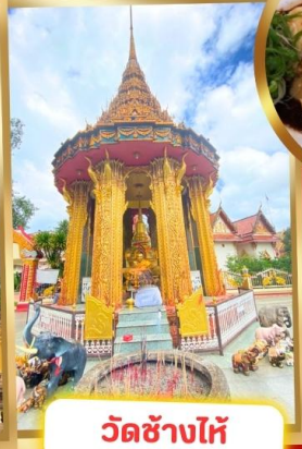
วัดช้างไห้