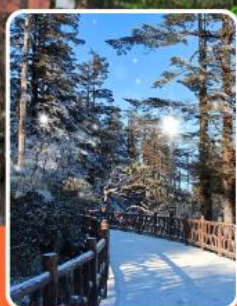
ภูเขาหว่าอูซาน