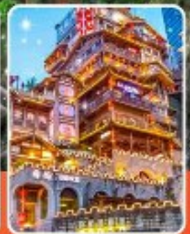
หงหยาดัง