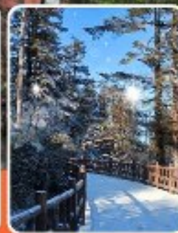
ภูเขาหว่าอูซาน