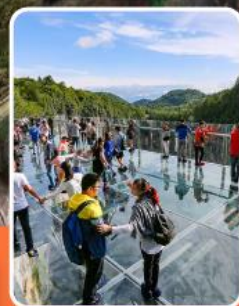
ระเบียงแก้วอุ่หลง