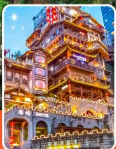
หงหยาดัง

เที่ยวฟิน 3 มรดกโลก เช็คอินครบทุกจุดไฮไลต์ !!