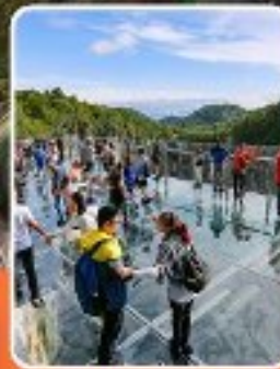
ระเบียบแก่ว๋หลง

ภูเขาหว่าอูซาน (รวมขึ้นกระเช้าไป-กลับ)- อุทยานเขานางฟ้า อุทยานหลุมฟ้าสะพานสวรรค์ - ระเบียบแก่ว๋หลง - รถไฟฟ้าทะเลตึก หงหยาดัง - วัดเป้ากั๋ว - หลวงพ่อโตเสอซาน - วัดต้าอิว หมี่เพนค้ายักษ์ ซ็องปิ่ง ถนนคนเดินซุนซ็อง ไร่ทุ๋หลี่