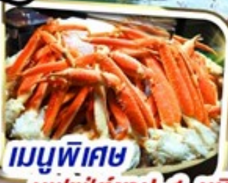
เมนูพิเศษ บุฟเฟ่ต์ชาบู 1 ชนิด